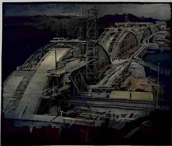
5. Carl Theodor Protzen: Donaubrücke bei Leipheim , 1936, Öl/Lw., 111 × 130,5 cm, Bayerische Staatsgemäldesammlungen

Ein weiteres Werk von Protzen, der Mittelteil seines Triptychons Straßen des Führers von 1939, wird bis heute auf Ausstellungen zur NS-Kunst gezeigt (Taf. 5). 26 Bereits 1974 war es bei der grundlegenden Präsentation Kunst im 3. Reich – Dokumente der Unterwerfung als einziges Autobahnbild zu sehen. 27 1999 hing es in Weimar in der Ausstellung Aufstieg und Fall der Moderne , in der vier Reichsautobahnbilder, ausschließlich von Protzen, präsentiert wurden. 28 In der Ausstellung Kunst und Politik im Nationalsozialismus in Bochum, Rostock und Regensburg war die zentrale Tafel 2016/17 erneut das einzige Werk zum Thema. 29 Es ist, wenn man von der ständigen Präsentation der Donaubrücke bei Leipheim in der Pinakothek absieht, das meistgezeigte Werk des Malers.