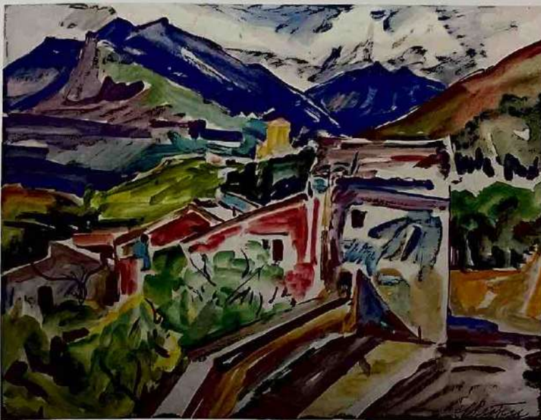
1. Carl Theodor Protzen: Monreale/Sizilien , um 1927, Mischtechnik auf Papier, 35,6 × 46,8 cm (größte Maße), Städtische Galerie im Lenbachhaus und Kunstbau München