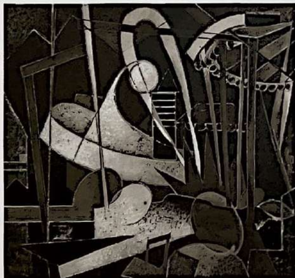
4. Carl Theodor Protzen: Neue Bauformen , um 1955, Mischtechnik auf Leinwand, 100 × 110 cm, Städtische Galerie im Lenbachhaus und Kunstbau München

er nach 1945 wieder in größerem Umfang nachgehen musste. Zwischen 1933 und Mai 1945 verkaufte Protzen 83 Gemälde. Nur 21 von diesen gingen an Privatpersonen, Museen oder Firmen, die am Bau der Autobahn beteiligt waren. Die restlichen 62 Werke kauften Personen oder Institutionen des Reichs. Somit ist Protzen eindeutig als Profiteur des NS-Systems zu beurteilen.