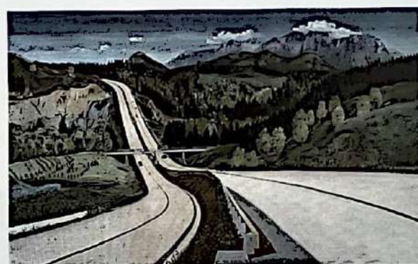
8. Wolf Panizza: Auffahrt zum Irschenberg , um 1936, Mischtechnik auf Leinwand, 94 × 150 cm, Verbleib unbekannt

Großen Deutschen Kunstausstellung ein, wie Aufkleber auf den Rahmen bestätigen, angenommen wurde aber nur der Mittelteil. In ihm ist, wie auf den meisten seiner Autobahnbilder, eine Baustelle zu sehen, hier eine in der bayerischen Holledau. Auf den Seitenteilen ist die menschliche Arbeit in Form monumentaler Personifikationen dargestellt, was für Protzen ebenso untypisch