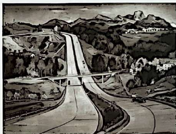
7. Carl Theodor Protzen: Auffahrt zum Irschenberg , 1937, Öl/Lw., 97 × 130 cm, Verbleib unbekannt