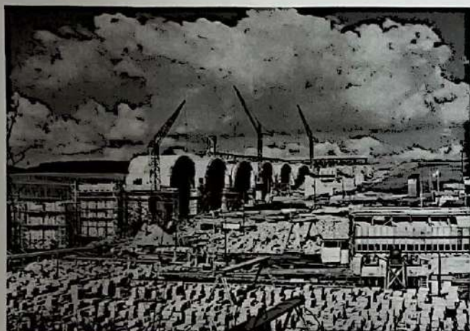
11. Reichsautobahnbaustelle in der Helledau, ca. 1938