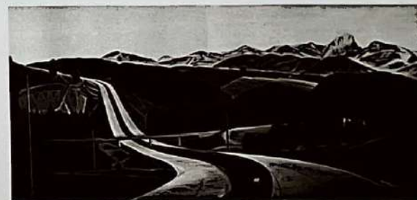
9. Alwin Stützer: Landschaft am Irschenberg , 1936, Mischtechnik, 54 × 110 cm, Verbleib unbekannt

Großen Deutschen Kunstausstellung ein, wie Aufkleber auf den Rahmen bestätigen, angenommen wurde aber nur der Mittelteil. In ihm ist, wie auf den meisten seiner Autobahnbilder, eine Baustelle zu sehen, hier eine in der bayerischen Holledau. Auf den Seitenteilen ist die menschliche Arbeit in Form monumentaler Personifikationen dargestellt, was für Protzen ebenso untypisch